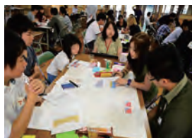
【ワークショップの様子】