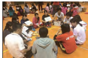
【ワークショップの様子】